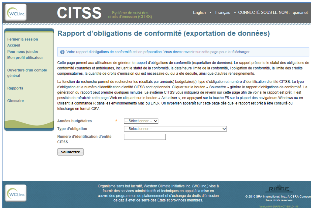
Figure 8 : Page « Rapport d'obligations de conformité (exportation de données) »

Une fois le rapport généré et la page du système CITSS rafraîchie, cliquer sur l'hyperlien sous le bouton « Soumettre » (Figure 9) afin d'ouvrir ou de télécharger le rapport demandé.