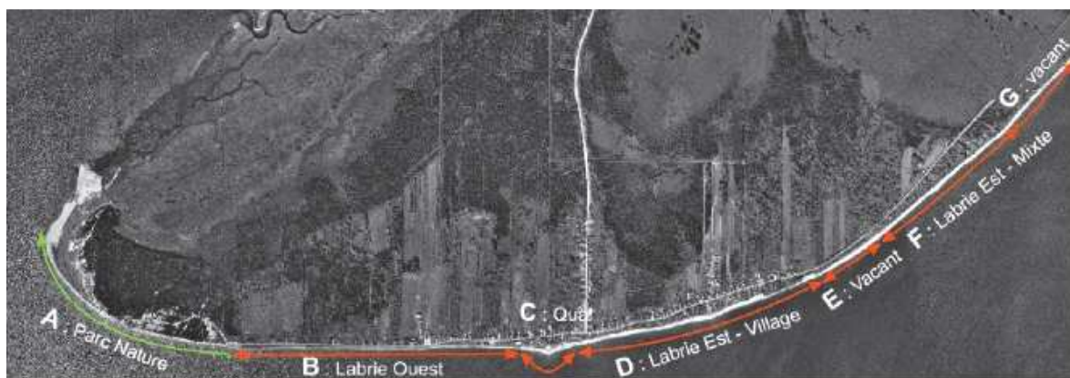
FIGURE 1 : LOCALISATION DU PROJET DE STABILISATION (MUNICIPALITÉ DE POINTE-AUX-OUTARDES, JUIN 2016)

En janvier 2016, la Municipalité de Pointe-aux-Outardes a contacté la Direction de l'évaluation environnementale des projets hydriques et industriels (DÉEPHI) afin de réactiver son projet et d'ajouter un type d'intervention à son programme, soit la mise en place d'une stabilisation par enrochement sur une longueur de 770 m du côté ouest du quai municipal (Figure 1-B). La Municipalité de Pointe-aux-Outardes a alors déposé au MDDELCC, le 16 juin 2016, une mise à jour de son étude d'impact environnemental. Une série de questions et commentaires lui a alors été transmise le 16 août 2016. Un document de réponses à ces questions a été déposé au MDDELCC, le 31 octobre 2016. Une deuxième série de questions et commentaires allait être envoyée sous peu à la Municipalité de Pointe-aux-Outardes. Or, le 6 décembre 2016, la Municipalité de Pointe-aux-Outardes a contacté la DÉEPHI afin d'entamer les démarches pour la présente demande de soustraction à la procédure d'évaluation et d'examen des impacts sur l'environnement. La Municipalité de Pointe-aux-Outardes désirait stabiliser temporairement la berge du côté ouest du quai municipal le plus rapidement possible afin de prévenir les dommages qui pourraient être causés par d'éventuelles tempêtes lors de l'hiver 2017. L'objectif principal de cette stabilisation temporaire est d'ainsi assurer la sécurité des usagers de la rue Labrie et éviter l'isolement des résidences dans le cas de l'effondrement de la rue.