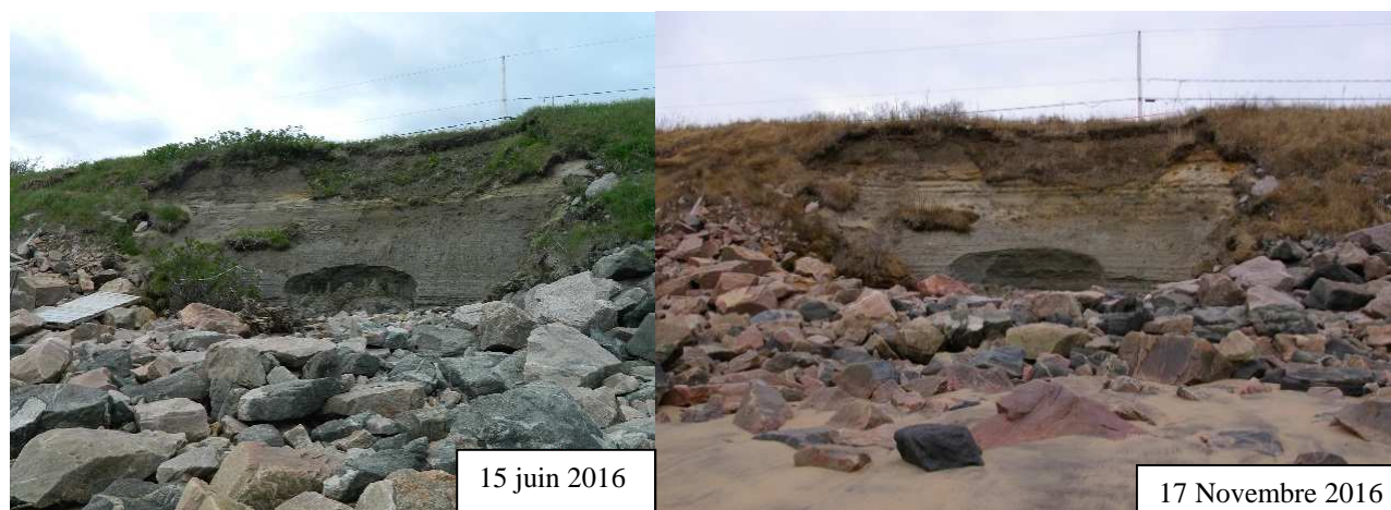
FIGURE 5 : PHOTOS JUIN 2016 ET NOVEMBRE 2016, 97 RUE LABRIE (MUNICIPALITÉ DE POINTE-AUX-OUTARDES, DÉCEMBRE 2016)