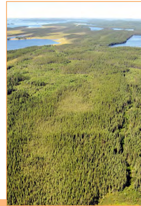
Le lac Tobie est entouré de tourbières et de forêts peu productives