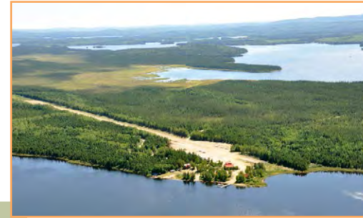
La pourvoirie Escapade et sa piste d'atterrissage

** Sauf si le ministre de l'Environnement et de la Lutte contre les changements climatiques a donné son autorisation.