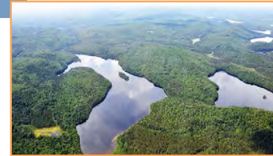
Les lacs Guynne (à gauche) et Sauvage (à droite) (A. R. Bouchard, MELCC)