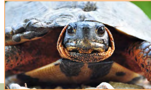
Tortue des bois ( Glyptemys insculpta ) (U. Dubé Marcoux, MDDEP)

** Sauf si le ministre de l'Environnement et de la Lutte contre les changements climatiques a donné son autorisation.