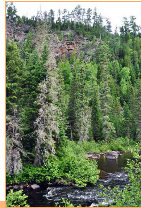
La rivière aux Rats longe la limite sud-ouest de la RBP