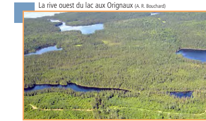
La rive ouest du lac aux Orignaux (A. R. Bouchard)