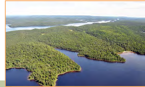
La partie ouest de la RBP (A. R. Bouchard)

** Sauf si le ministre de l'Environnement et de la Lutte contre les changements climatiques a donné son autorisation.