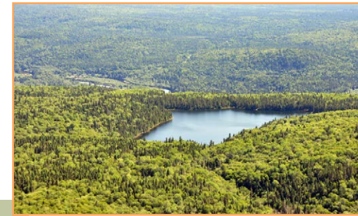
Après la rivière Croche, le lac Slide est le plan d'eau le plus important de la RAP

** Sauf si le ministre de l'Environnement et de la Lutte contre les changements climatiques a donné son autorisation.