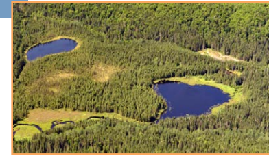
Les lacs Flâneur et de la Courge