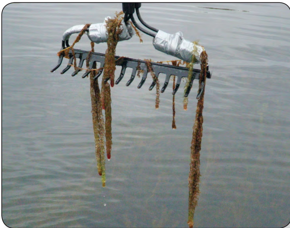
Râteau à tête double

Les plantes aquatiques sont une composante naturelle et essentielle de la zone littorale des lacs. Elles constituent un habitat important pour les poissons et les autres organismes aquatiques, de même que pour les oiseaux et mammifères qui fréquentent la zone riveraine. De plus, les plantes aquatiques produisent de l'oxygène, maintiennent les sédiments en place au moyen de leurs racines et réduisent l'érosion. Le défi de quiconque s'intéresse aux plantes aquatiques est d'observer ce qui croît sous la surface de l'eau. Ceci est particulièrement vrai pour les plantes submergées qui poussent en eau plus profonde.